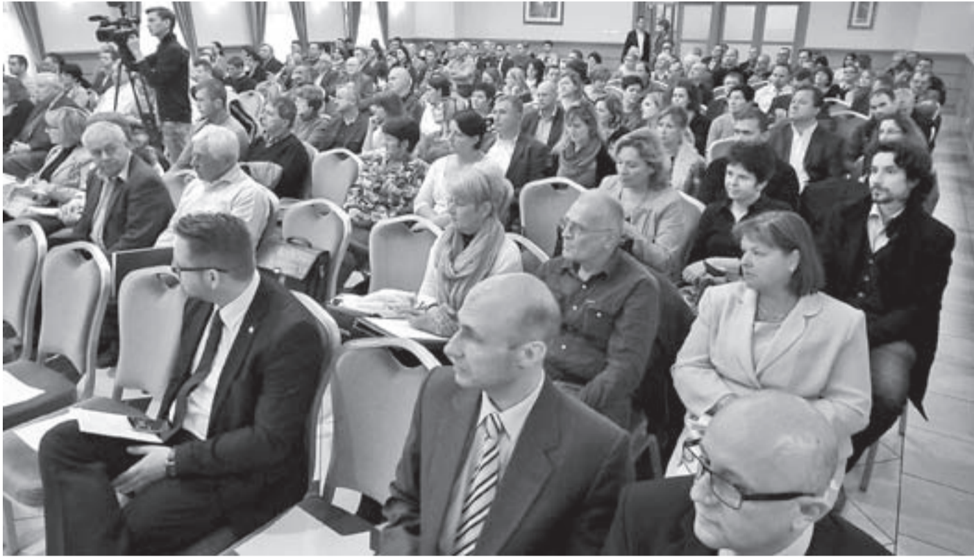
Nagyon nagy a várakozás a vállalkozók körében a pályázatok iránt

PÉNZÜGYEK Hatalmas érdeklődés a kamarai rendezvényen