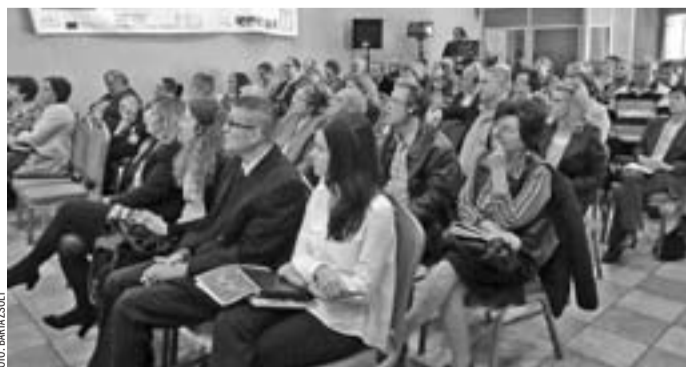
A történelmi Bácska mindkét – magyar és szerb – oldaláról voltak érdeklődők a rendezvényen.

A Kiváló Bácskai Termékek széles körű megismertetésének lehetőségei címmel szerveztek konferenciát Baján, melyen mintegy hetven vendég vett részt. A rendezvényre a hazai és határon túli gasztronómiával és turizmussal foglalkozó cégek szakemberei azzal a céllal mentek el, hogy az új információk birtokában fejleszthessék a vállalkozásaikat. A Bács-Kiskun Megyei Kereskedelmi és Iparkamarának két programja is van, amelyek szervesen kapcsolódnak egymáshoz. Az egyik a Kiváló Bácskai Termék díj és az ehhez kapcsolódó Bácskai Nap, a másik pedig a Gasztróklub. Ezt a