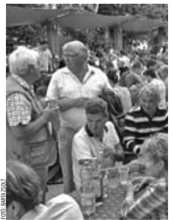
Az idén is több száz vendég vett részt a Hírös Vacsorán

A nagybaracsai megbeszélésen több környékbeli település polgármestere is részt vett, így lehetőség nyílt a kamarával történő együttműködés lehetőségeinek megtagyalgására. Az őszi önkormányzati választást követően ez az első olyan kamarai esemény, ahol a megválasztott új polgármesterekkel megtörtént a kapcsolatfelvétel. A tervek szerint a járási gazdasági fejlesztéseinek lehetőségeiről a jövőben is lesznek majd hasonló egyeztetések a kamara vezetősége és a megye városainak polgármesterei között.