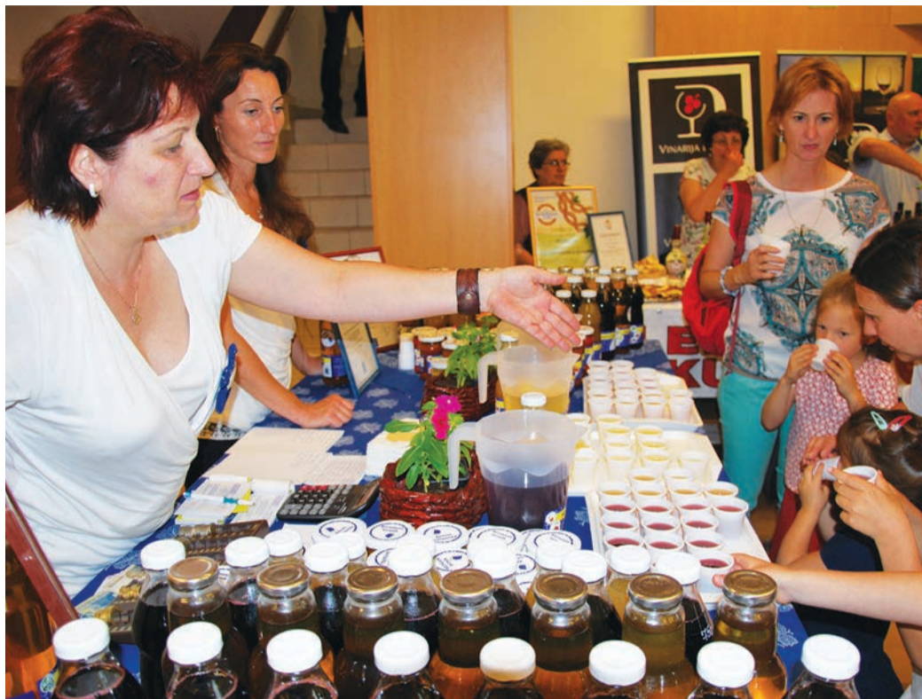
A bácsalmási szörpök iránt komoly érdeklődés mutatkozott

– A 2005-ös Bácska Expo egy háromnapos nagyren-