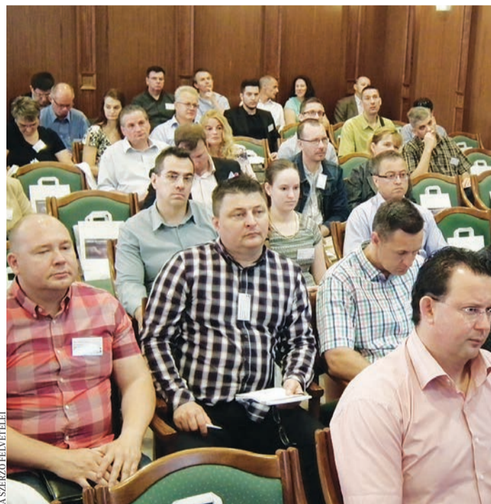
A konferencia résztvevői érdeklődéssel hallgatták az előadókat

en vásároltak kisképernyős eszközön! A használók 1/3-a számára a letölthető alkalmazások a fontosak! A megyében működő kkv-k 55%-a rendelkezik honlappal, ennek csupán a 25%-a „mobilbarát”. Saját mobilapp-pal 0,5–1% rendelkezik! Pedig az okostelefonjainkon a napi internetezésünk 50%-át végezzük.