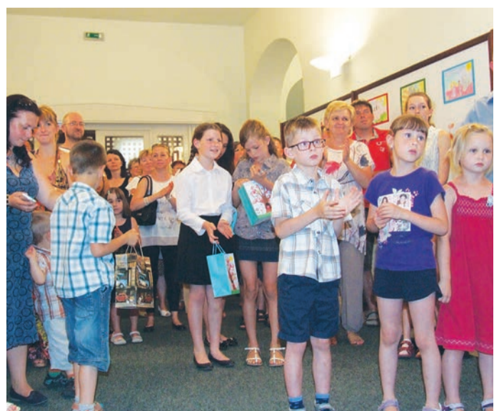
Járt a taps a rajzpályázat díjazottjainak