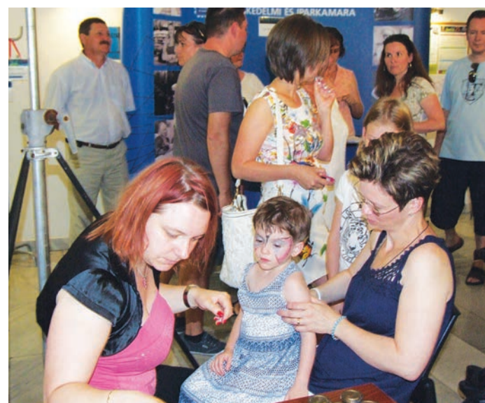
Az arcfestés szinte minden gyermeknek kedvence