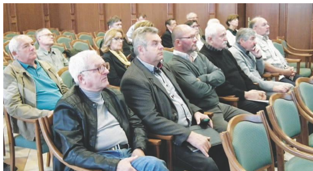
A vizsgálóelnökök 20 órás szakmai továbbképzésen vettek részt

A mestervizsga-bizottság elnöki tisztsége pályázat útján nyerhető el. A pályázatot ötévenként, a mandátumok lejártá előtt az MKIK elnöke hirdeti meg, aki az illetékes területi kamara kézműipari tagozat elnökének véleménye, valamint, az elnökség javaslata alapján dönt a kinevezésről. Az adott évben kiállított megbízólevél érvényessége a kinevezéstől számított 5. év november 1-jéig érvényes. Jelenlegi elnökök kinevezése a