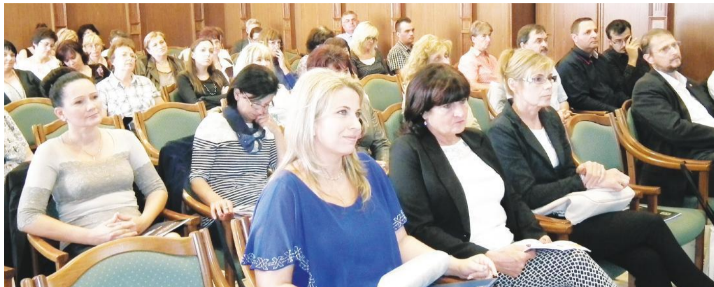
A szakmai konferencia résztvevői a kamara dísztermében

OKTATÁS Pályaválasztási kiállításokat rendeznek ősszel