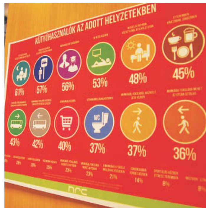
Számos elgondolkodtató adatról értesülhettek a résztvevők

tében. Az előadásokban szó volt többek között informatikai megoldási lehetőségekről, a jó weblap ismérveiről, vállalatirányítási rendszerekről és pályá-