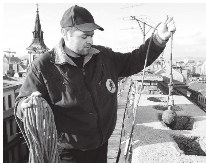
A kéményseprés rendkívül fontos feladat

- Az ügyintézés megkönnyítése érdekében a honlapunkról letölthető megrendelőlap kitöltésével és visszaküldésével megrendelhetik cégüktől a kötelező kéményseprőipari szolgáltatást. Több telephellyel rendelkező ügyfelek és többéves szolgáltatás megrendelése esetén lehetőség van írásbeli megállapodás meg-