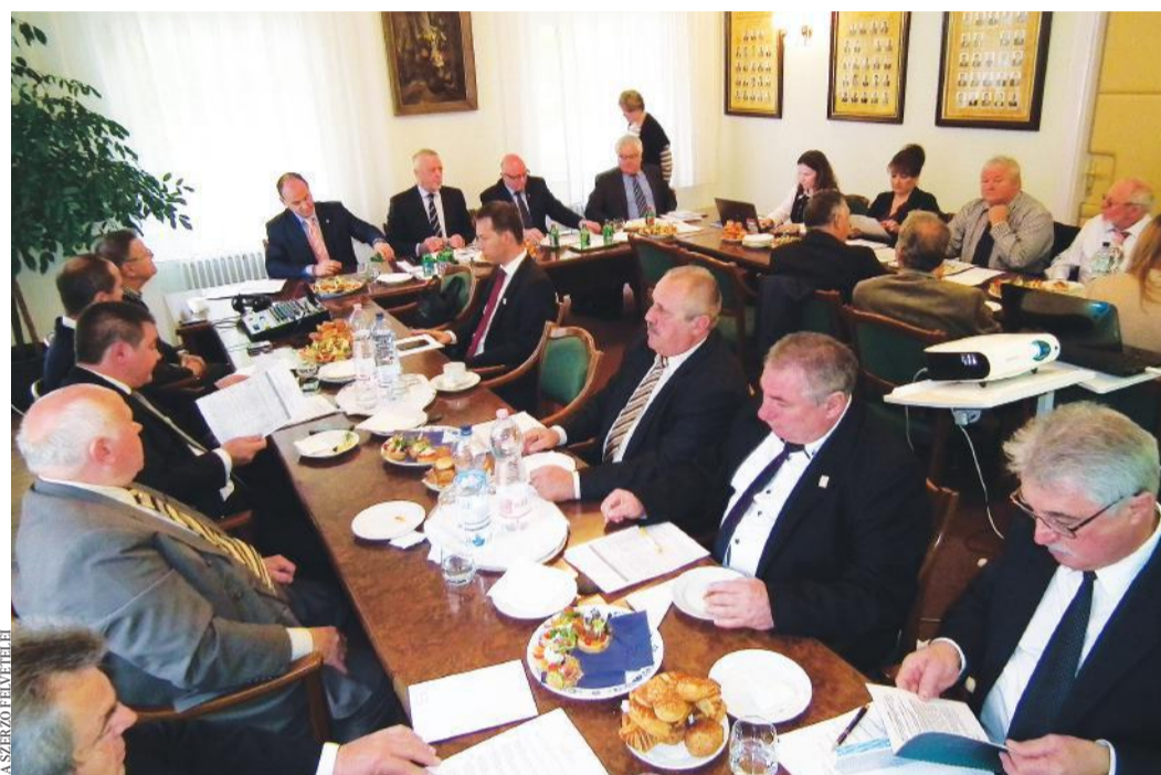
A kamarai elnökség első ülése a választás után

adatot, biztosan ezt is képes lenne jól működtetni a kamarai rendszer, természetesen a szükséges szervezeti, létszám- és technikai fejlesztések után. Sok a feladatunk a szakképzés területén is. Sajnos egyre kevesebb gyermek születik, és egyre kevesebben akarnak szakmát tanulni. A kamarának a következő négy évben még alaposabban meg kell ismeretnie az alkotó kétkezi hivatásokat. Néhány gondolat erejéig rátérnék a megye gazdasági életére. Sajnos a térség északi és déli megosztottsága nem változott. Az északkeleti térségben Kecskemét központtal a megye ipari termelésének a kétharmadát a jármű- és gépgyártás adja. A kamarának a fejlődést kell elősegítenie, ezért ápolunk szoros kapcsolatokat a nagyvállalatok mellett Kecskemét önkormányzatával, a képzőintézményekkel, az új egyetemmel, valamint a hivatalok vezetőivel is. A városnak biztosítania kell azt az infrastruktúrát, mely a betelepülő új munkaerőt kiszolgálja. Ez ugyan nem kamarai feladat,