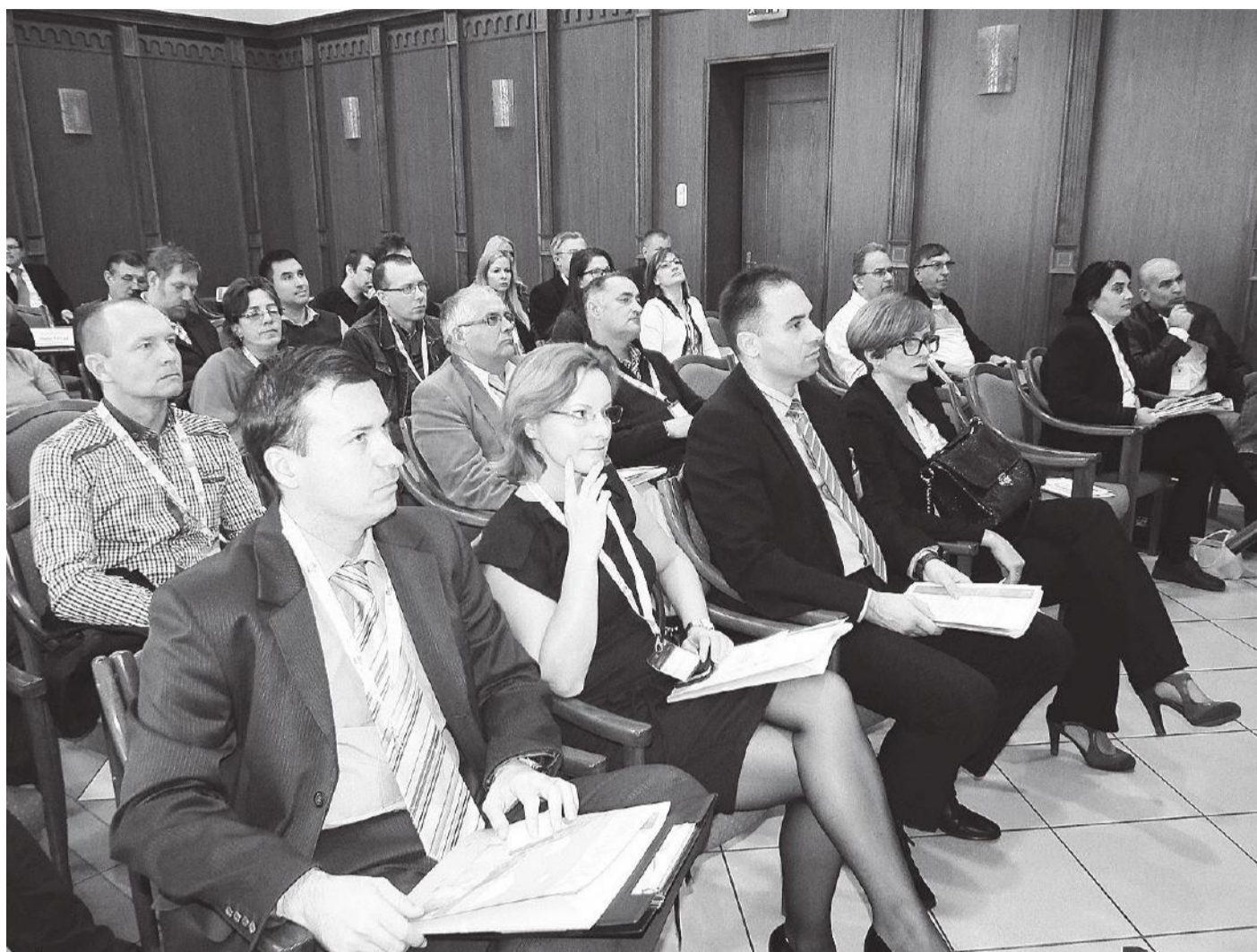
Románia, Szlovákia, Horvátország, Szerbia felé történő piaci nyitásról hallgattak tájékoztatókat a cégek képviselői

KERESKEDELEM Külpiaci lehetőségek Közép-Európában