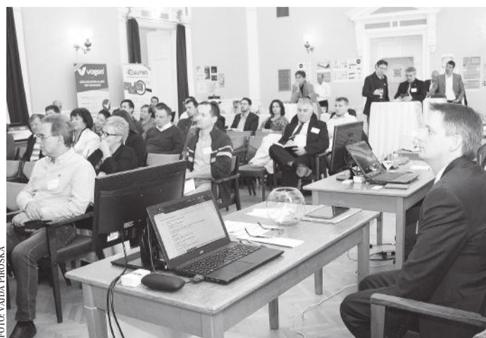
Sokan voltak kíváncsiak a fórum előadásaira

novemberben Kalocsán lesz, illetve jövő tavasszal Kiskunhalason és ismét Kecskeméten. A minősítésnek feltétele ugyanis a rendezvényen való részvétel és a tanácsadókkal való konzultáció is – tette hozzá Nyerges Tibor. V. P.